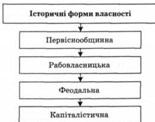
Рис. 1.3. Еволюція форм власності

Найскладнішою проблемою економічної науки є проблема форм власності. Існують два підходи до класифікації форм власності: вертикально-історичний і горизонтально-структурний . Вертикально-історичний, підхід визначає історичні форми власності , які зароджуються у процесі тривалої еволюції суспільства, і зміни однієї форми власності іншою (рис. 1.3). Кожному етапу розвитку людського суспільства відповідає певна форма власності, яка відбиває досягнутий рівень розвитку продуктивних сил, особливості привласнення засобів і результатів виробництва та основного суб'єкта, який концентрує права власності.