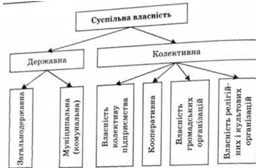
Рис. 1.5. Сучасні форми суспільної власності

Загальнодержавна власність - це спільна власність усіх громадян країни, яка не поділяється на частки і не персоніфікується між окремими учасниками економічного процесу.