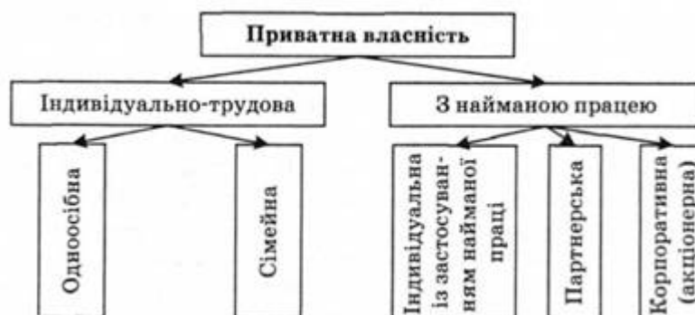
Рис. 1. 4. Сучасні форми приватної власності

Приватний тип власності виступає як сукупність індивідуально-трудової, сімейної, індивідуальної з використанням найманої праці, партнерської і корпоративної форм власності (рис. 1.4).