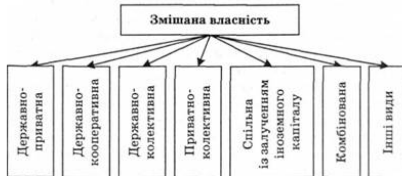
Рис. 1.6. Сучасні форми змішаної власності

Змішана власність поєднує різні форми власності - приватну, державну, колективну, кооперативну та інші, в тому числі й власність іноземних суб'єктів (рис. 1.6).