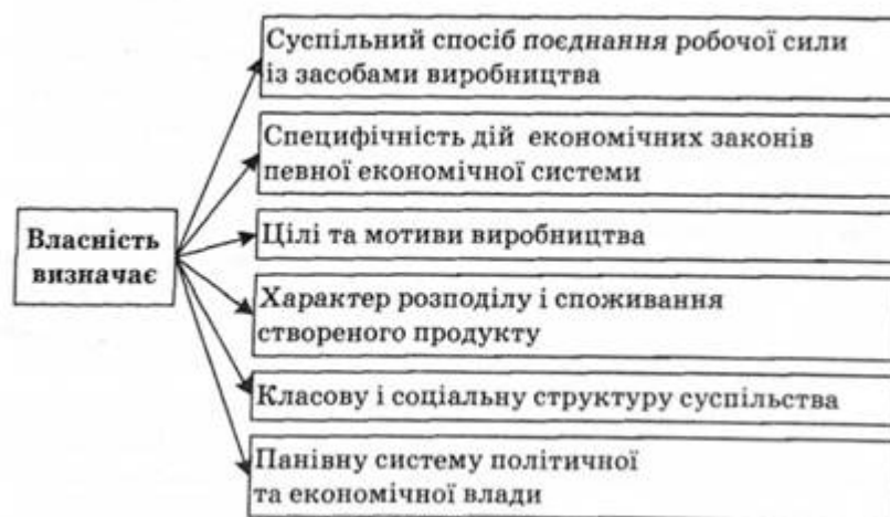
Рис. 1.1 Місце власності в економічній системі

Виражаючи найглибинніші зв'язки і взаємозалежності, власність, таким чином, розкриває сутність соціально-економічного буття суспільства.