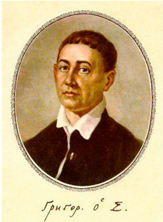
Григорій Савич Сковорода (1722 — 1794 рр.)