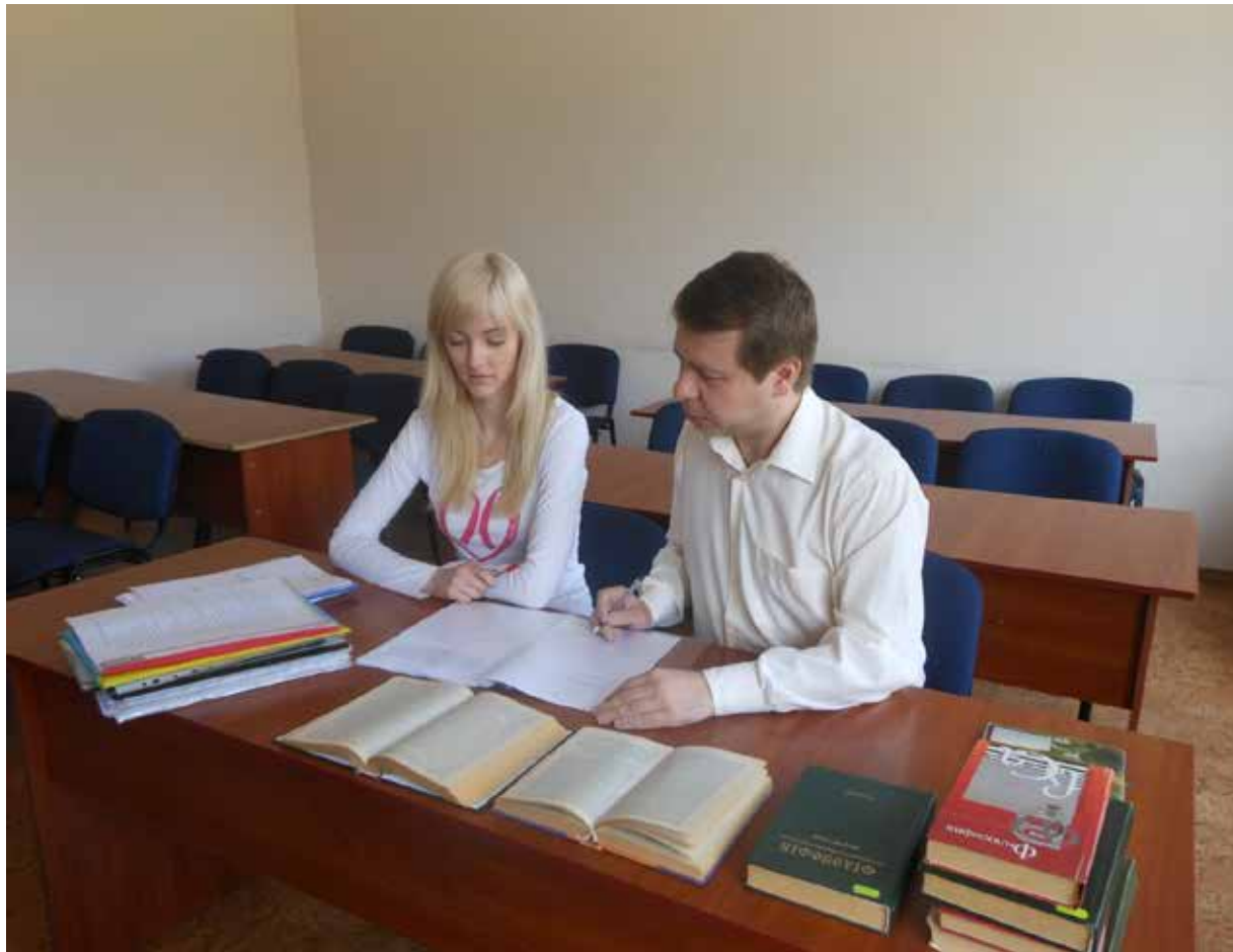
Підготовка тексту методичних рекомендацій