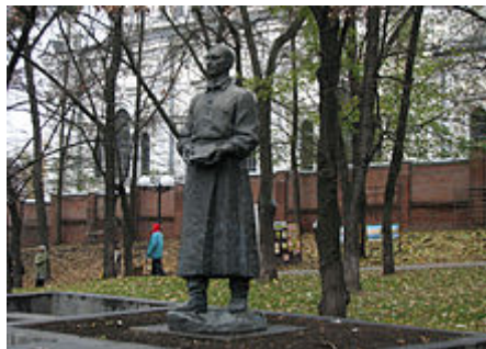
Пам'ятник Г.С. Сковороді в м. Харкові