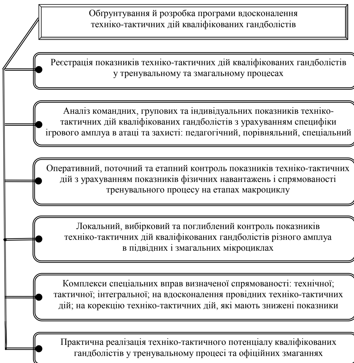
Рис. 2. Структура практичної реалізації програми вдосконалення техніко-тактичної підготовленості кваліфікованих гандболістів

Враховуючи особливості змагальної діяльності в гандболі – тривалий змагальний період (6-8 місяців), розроблена програма вдосконалення техніко-тактичних дій спрямована для застосування переважно в підвідних і змагальних мікроциклах.